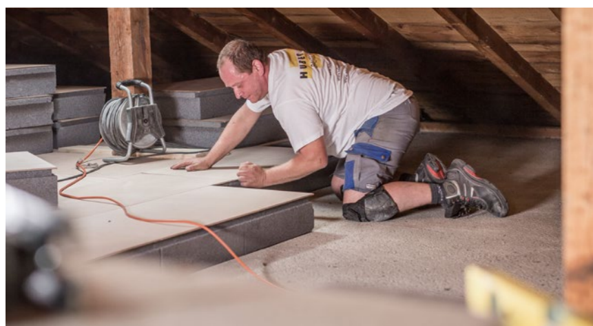
Installation simple et rapide d'une isolation thermique au niveau des combles de type AT.

Attica-Therm® est un nouveau système d'isolation pour sous-sol et zones de combles, particulièrement facile à installer. L'isolation thermique Attica-Therm® est constituée de panneaux composites en mousse rigide, composée de polystyrène ignifuge de qualité Neopor F20 et de panneaux en fibres de bois, collés et pressés à chaud. Une connexion spéciale légèrement articulée permet une installation exempte de distorsions, même sur des surfaces non planes.