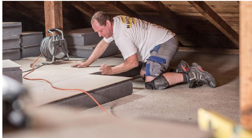
Schnelle und einfache Montage der Estrichbodendämmung Typ AT.

Attica-Therm® ist ein Neu- und Nachdämmsystem für den Keller- und Estrichbereich, das besonders einfach zu verlegen und montieren ist. Die Wärmedämmung Attica-Therm® besteht aus Verbundplatten, die aus schwer brennbarem Polystyrol-Hartschaum der Güteklassen Neopor F20 und aufgeklebten, warm verpressten Holzfaser-Hartplatten zusammengesetzt sind. Eine leicht gelenkige Spezialverbindung ermöglicht auch auf unebener Unterlage eine dauerhaft verzugsfreie Oberfläche.