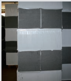
Anlieferung Wärmedämmung Neopor M20 (oder EPS F20)