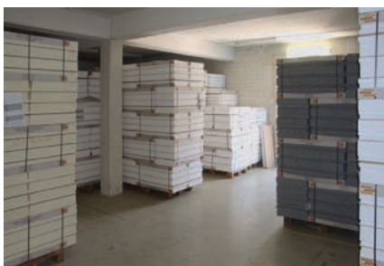
Grosses Lager von ATTICA-THERM