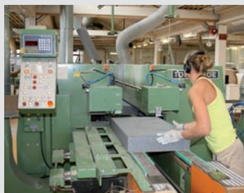
ATTICA-THERM Spezial-Längsprofil wird gefräst, anschliessend Querprofil