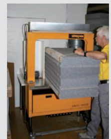
In handliche Pakete verpackt und zum Abtransport bereitgestellt