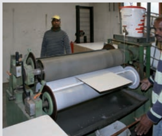
Deckschicht Renolack-Platte oder Hartfaserplatte wird vollflächig mit Wärmedämmung verleimt