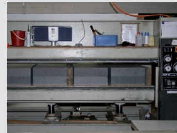
Wärmedämmung und Deckschicht werden warm verpresst